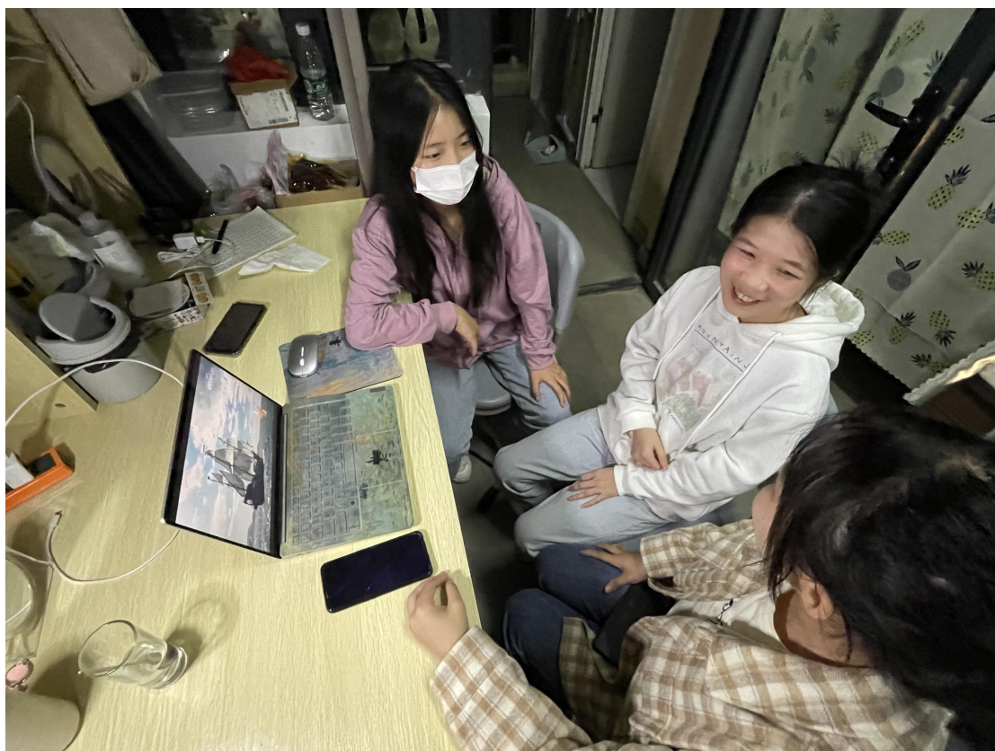
观看大国保险后的讨论