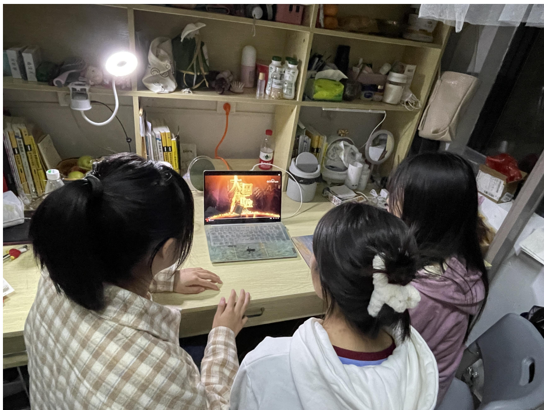
课后观看大国保险