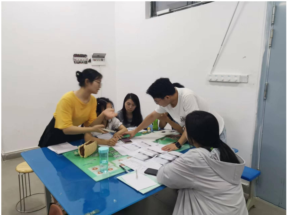
课后分组案例讨论